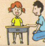
子どもに寄り添う個別ケア

必要に応じて、一旦集団生活から離れ、 生活支援スタッフと1対1で過ごします。 心理士が心に寄り添い、 ともに考える時間があります。