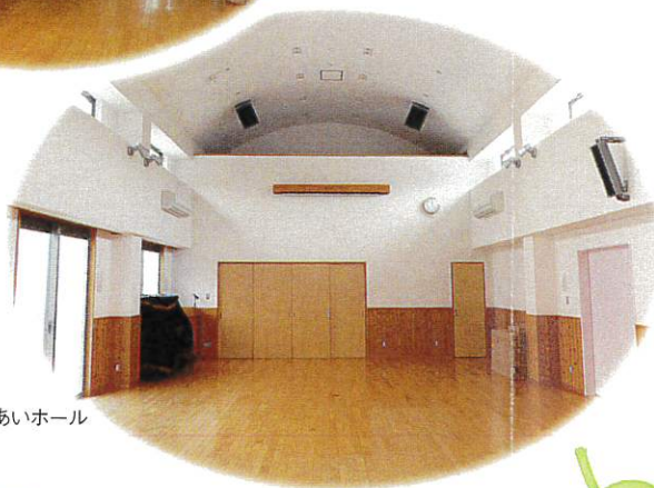
地域ふれあいホール